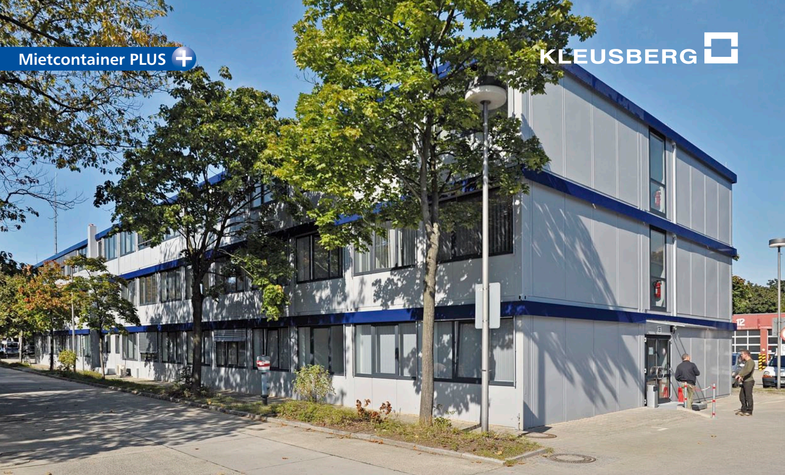
Die Polizeidirektion II in einem neuen Gebäude aus Mietcontainern PLUS von KLEUSBERG.