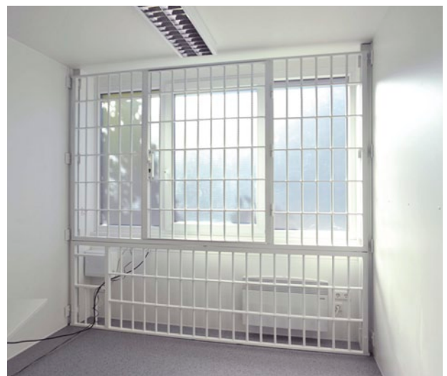
Innenliegende Fenstergitter, verschließbar mit Dreipunktverriegelung als zusätzliche Sicherungsmaßnahme.