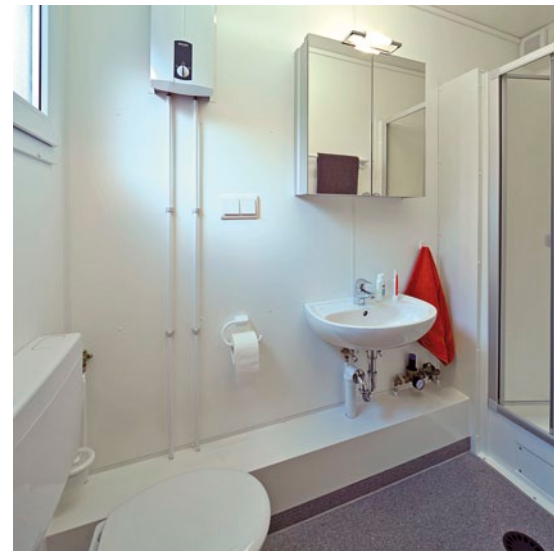
Funktionelles Bad mit WC, Dusche, Waschbecken und Spiegelschrank.

Ist die Baustelle abgeschlossen, reist Ihr Hotel-Container mit allen persönlichen Gegenständen weiter zur nächsten Baustelle. Alles bleibt in Ihrem Zimmer und steht Ihnen auf der nächsten Baustelle gleich zur Verfügung. Einfacher geht's nicht!