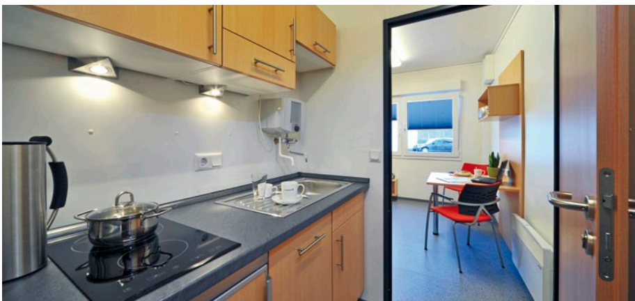
Küchenzeile mit Ceran-Kochfeld, Spülmaschine und Kühlschrank.